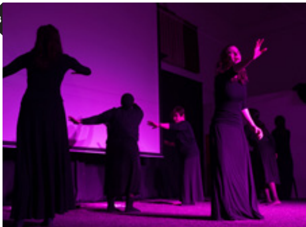
צילום: בני ברק